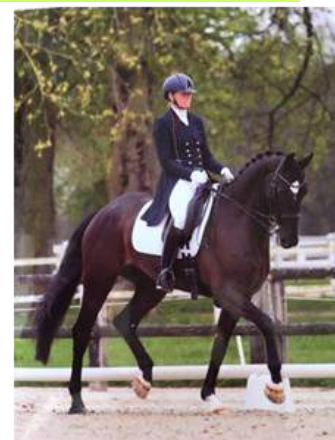
Ecurie du manoir