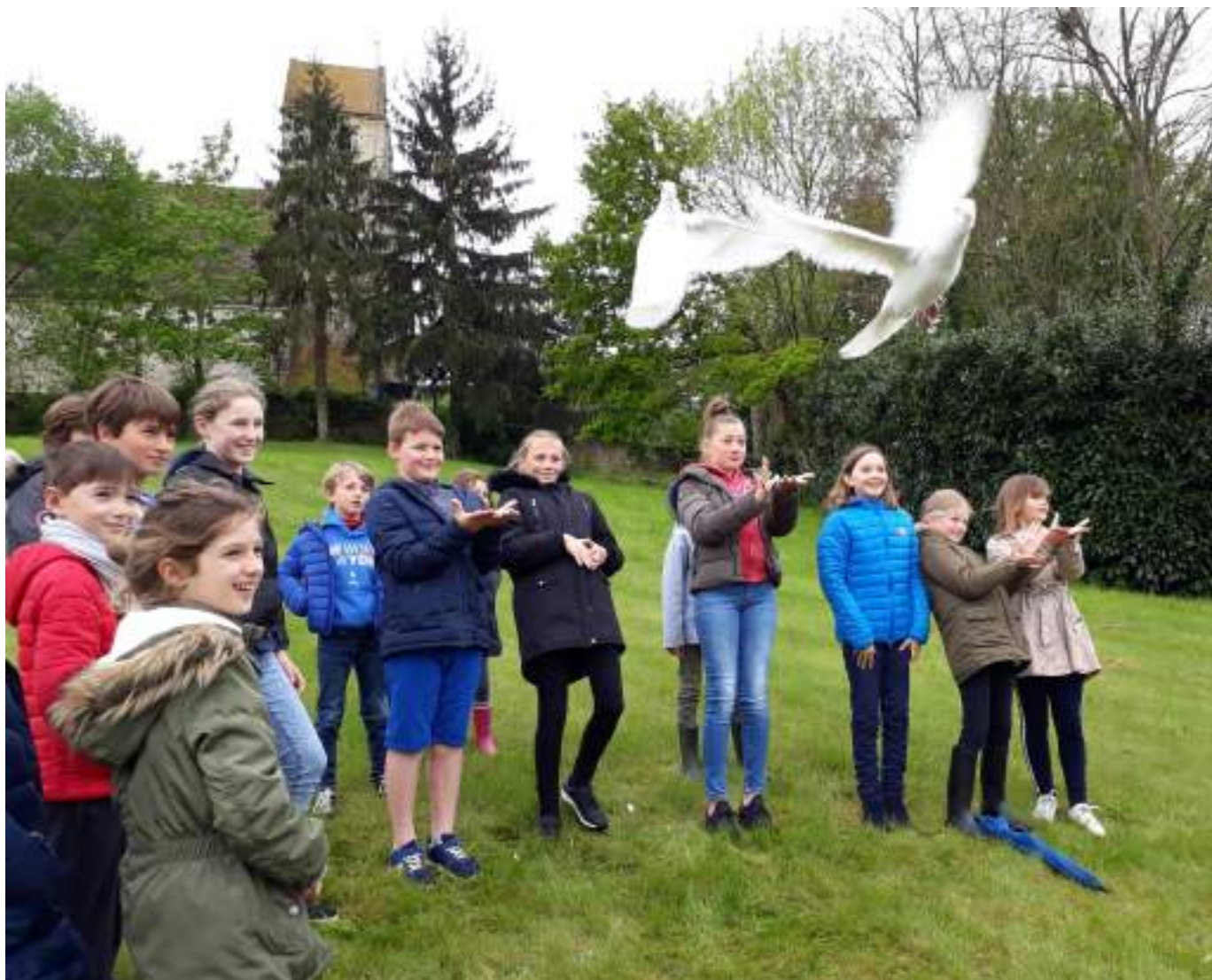
Lancer de colombes pour le 8 mai