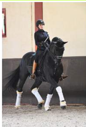
Five stars ranch

Nous vous donnerons enfin rendez-vous sur la place du village pour un « goûter apéritif » autour nous l'espérons, d'un carrousel de chevaux de bois pour les plus petits.