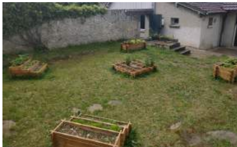
Bacs de jardinage à l'école

Ainsi les jours s'écoulent et nous rapprochent de la fête où nous vous espérons nombreux.