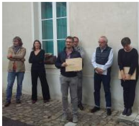
Projection des films dans la salle du Conseil municipal