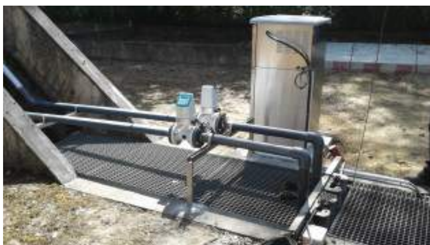
Analyse des eaux en aval de la station