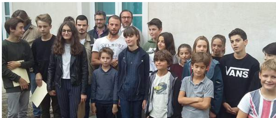
Proclamation des résultats