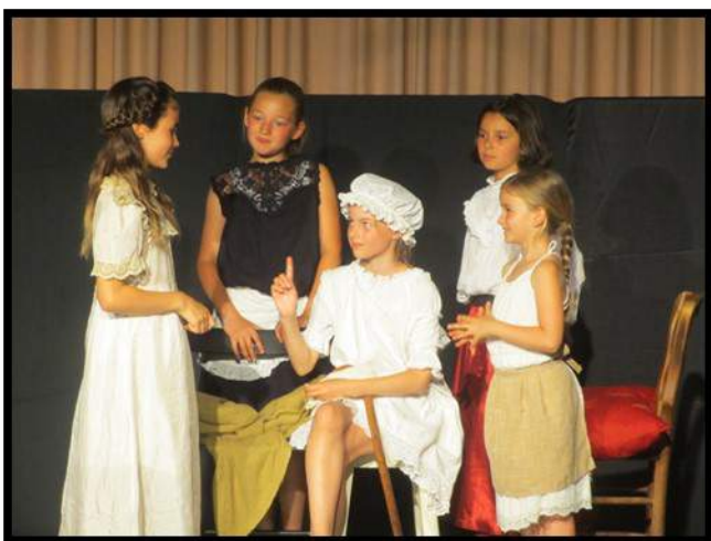
« Une malade imaginaire »

GRAND PRIX DU JURY du Festival de St Rémy L'honoré « Place aux jeunes 2017 »