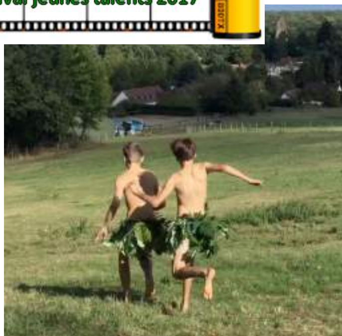
« Deux sapiens dans la ville »