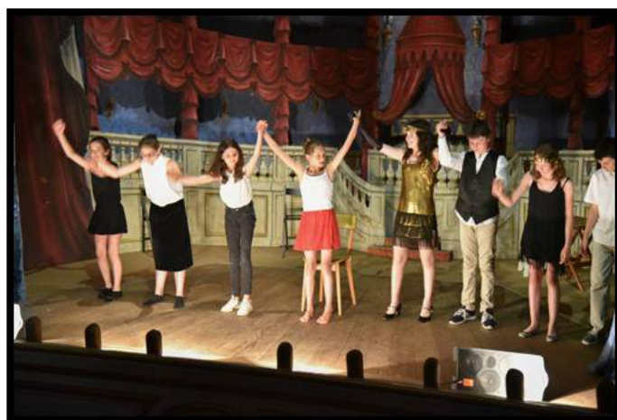
Triomphe au Château de Groussay