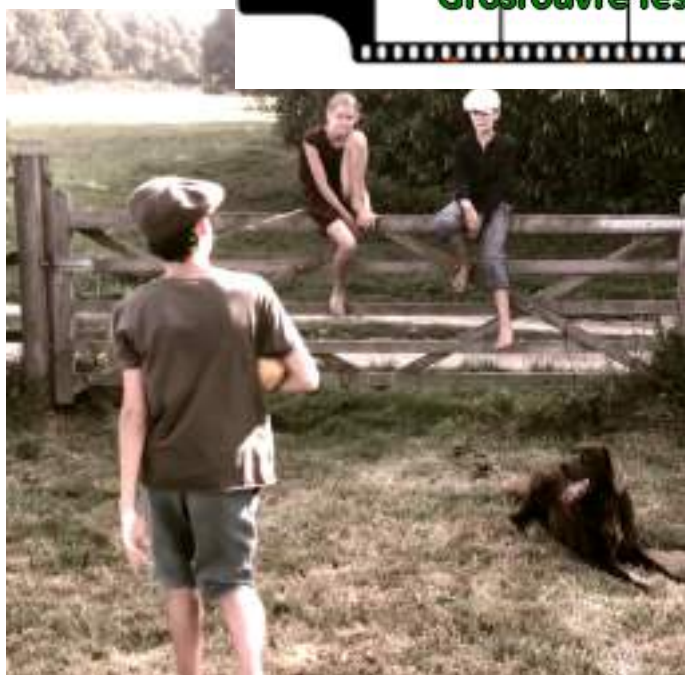
« La bêtise »