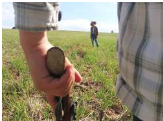
« Il était une fois à Grosrouvre »