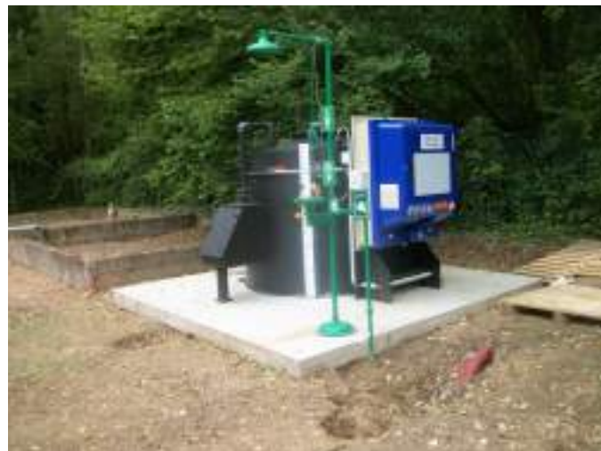
nouvelle unité de déphosphatation de la station

Cette unité seule a coûté 23 000 € HT, subventionnés pour 50 % par l'Agence de l'eau Seine Normandie .