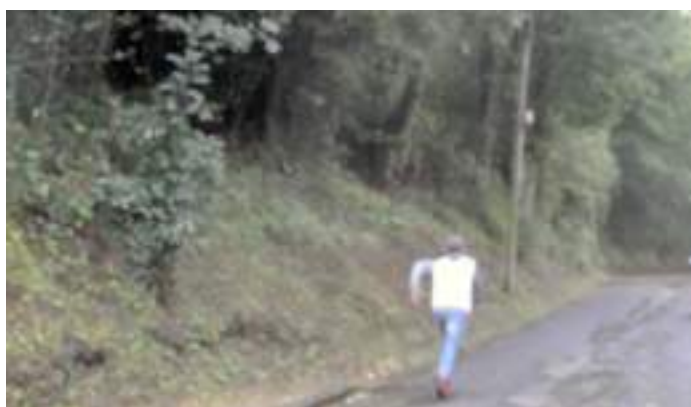
« Just a silhouette »